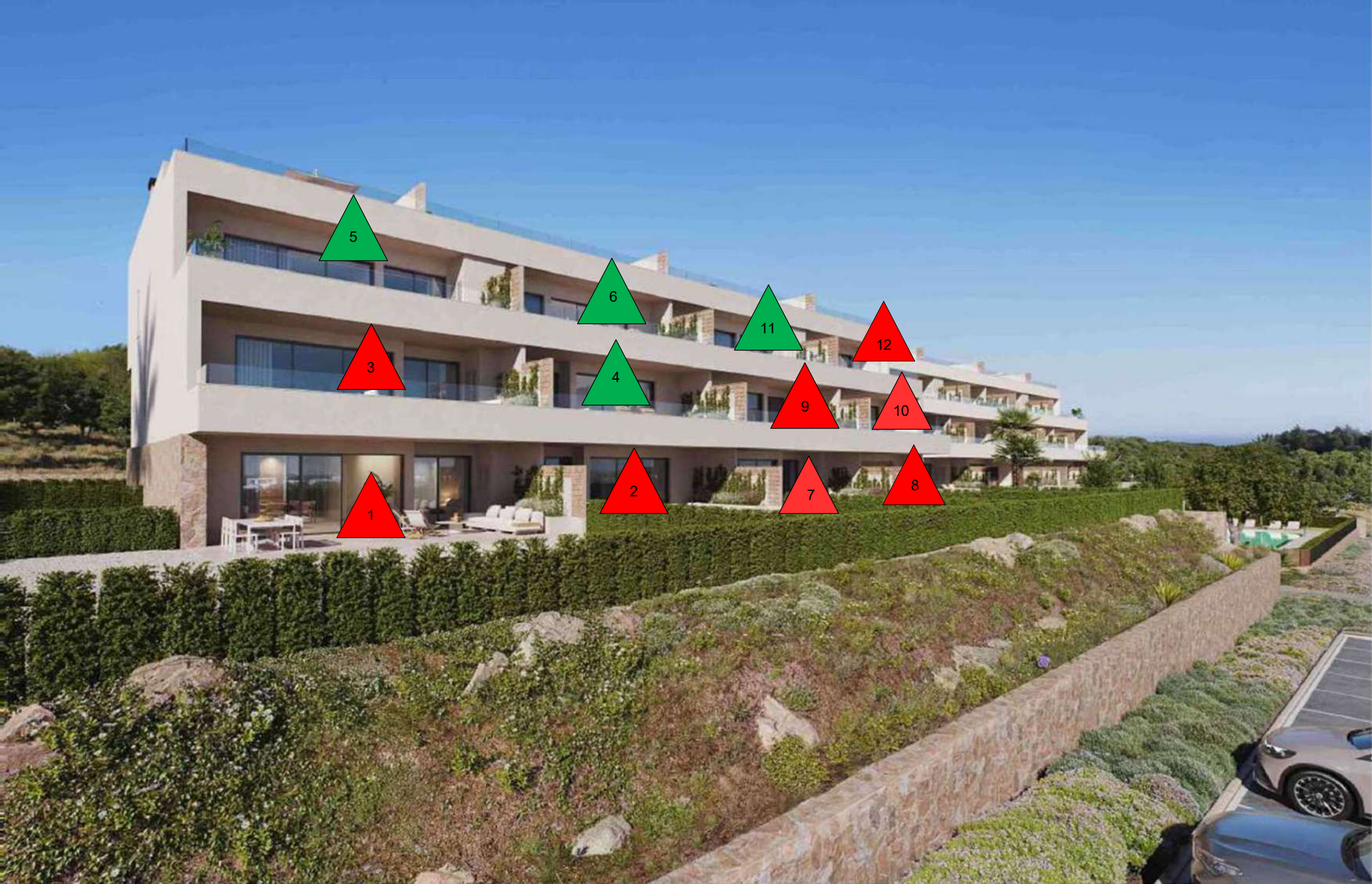
Esta infografía es un boceto preliminar de la Comunidad Limonero creado por ordenador con fines meramente ilustrativos y no vinculantes. El diseño final puede estar sujeto a modificaciones. This image is a preliminary draft of the Limonero Community and is created by computer as an illustration but is not binding. The final design may undergo some changes.