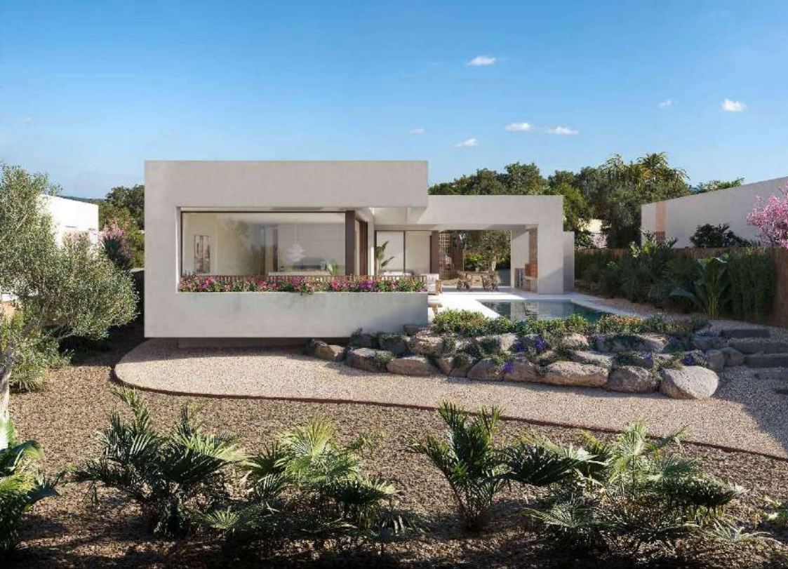
MODELO / MODEL A