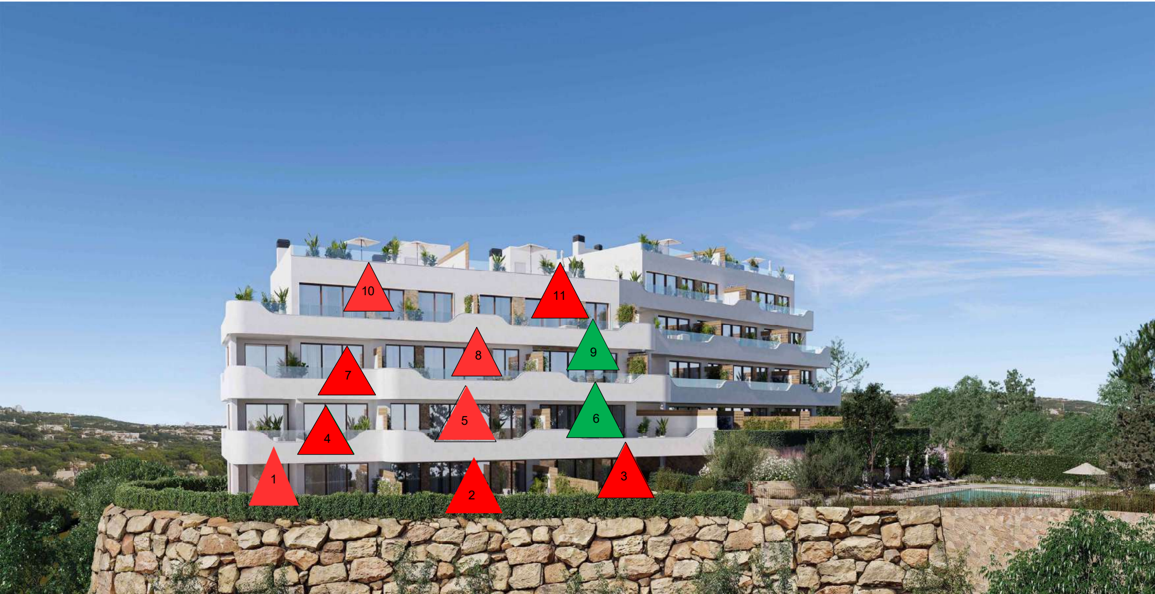
Esta infografía es un boceto preliminar de la Comunidad Limonero creado por ordenador con fines meramente ilustrativos y no vinculantes. El diseño final puede estar sujeto a modificaciones. This image is a preliminary draft of the Limonero Community and is created by computer as an illustration but is not binding. The final design may undergo some changes.