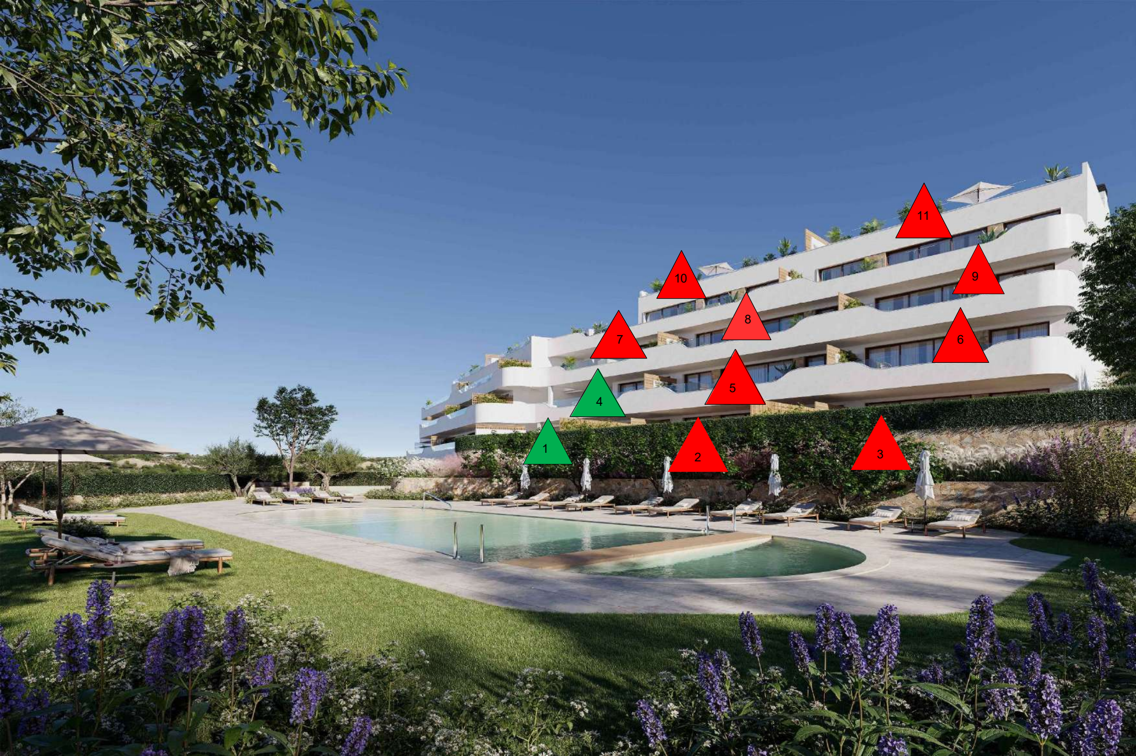
Esta infografía es un boceto preliminar de la Comunidad Limonero creado por ordenador con fines meramente ilustrativos y no vinculantes. El diseño final puede estar sujeto a modificaciones. This image is a preliminary draft of the Limonero Community and is created by computer as an illustration but is not binding. The final design may undergo some changes.